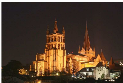
Cathédrale de Lausanne