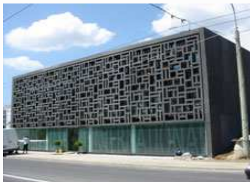
Maison du Sport - Lausanne